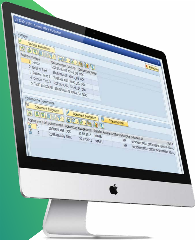
Alle Vorlagen gesammelt an einem Ort per Knopfdruck zu erreichen