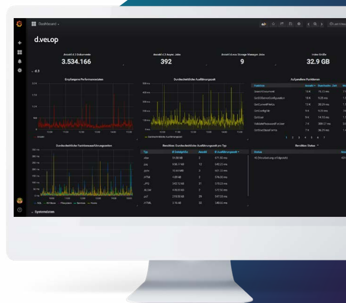
d.velop metrics analyzer überwacht verschiedene Prozesse Ihres Systems und stellt Performancedaten grafisch aufbereitet zur Verfügung. Hier am Beispiel von d.3ecm.