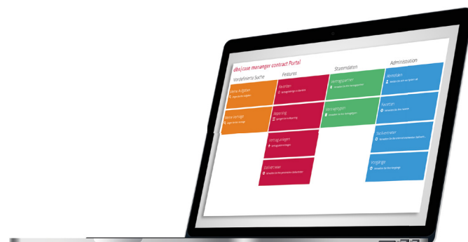
dbs | case manager contract ist Ihr perfekter Einstieg in die digitale Vertragsverwaltung.

flexibel und gleichzeitig verbindlich standardisieren. Die Vorgangsakte im d.3ecm bündelt nicht mehr nur Dokumente, sondern auch Aufgaben und Konversationen, die langfristig zur Verfügung stehen. Komfortable Vertragsübersichten schaffen jederzeit Transparenz über den gesamten Vertragsbestand und unterstützen Sie beim Vertragscontrolling. Angepasst auf Ihre individuellen Anforderungen integriert sich dbs | case manager contract nahtlos in Ihre Arbeitswelt. So schaffen Sie alle Voraussetzungen für ein professionelles, digitales Vertragsmanagement in Ihrem Unternehmen.